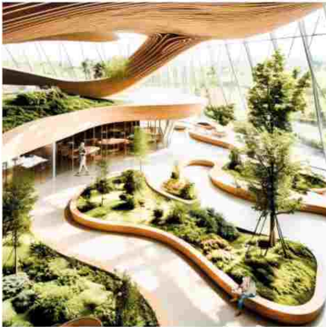
Das Vivaneum ist als Naturerlebnis-Haus mit großen Glasfassaden geplant.