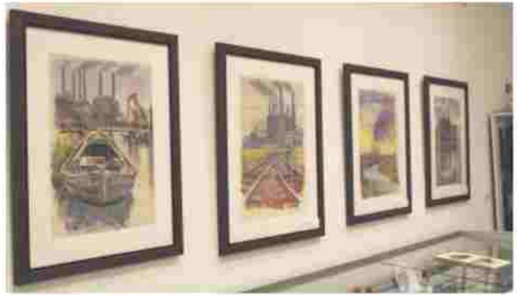
In seiner Zeit in Hohenfelde malte Hermann Degkwitz auch zahlreiche Aquarelle, die heute dem Heimatmuseum Lägerdorf gehören. Viele von ihnen zeigen die ehemalige „Breitenburger Portland-Cementfabrik“.

Krempe (JH) In Lübeck wurde 2023 erstmals ein Schiffswrack geborgen. Einen Vortrag über diese Aktion hält Dr. Felix Rösch, der Unterwasserarchäologe der Stadt Lübeck, am Freitag, 24. Januar, im Haus der Krempermarsch, Stiftstraße 16 in Krempe. Die Volkshochschule Krempe lädt ein. Die Teilnahme kostet fünf Euro.