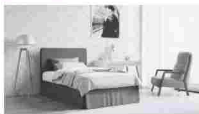
Das richtige Bett erleichtert das Aufstehen – und sorgt für angenehmen Schlaf.

Angesichts dieser Lebenserwartung macht eine allzu beschleppene Lieberführung auch im fortgeschrittenen Alter also keinen Sinn. Im Bereich des Bettes und der Bettausstattung ist sie sogar gesundheitsschädlich. Vor allem durchgelegene Matratzen oder Zudecken mit verklumpter Füllung können dann schnell unangenehme Auswirkungen haben. Statt der im Alter besonders wichtigen Erholung sind dann nämlich oftmals eine Erkältung und verstärkte Rücken- oder Gelenkschmerzen die Folge. Eine zunehmende Zahl älterer Menschen hat dies mittlerweile erkannt und erneuert