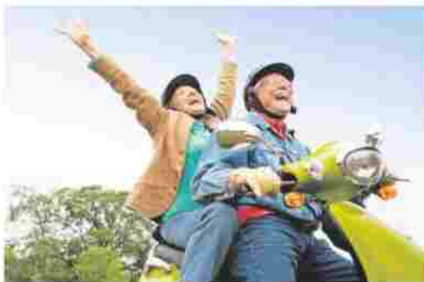
Viele ältere Menschen fühlen sich heute jünger als sie nach Lebensjahren sind.