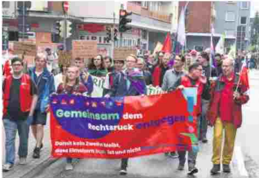
Das Bündnis für Demokratie Elmshorn organisierte bereits 2024 eine Demo gegen Rechtsextremismus. Die Aktiven wollen zeigen, dass die Mehrheit der Gesellschaft bereit ist, sich den Gefahren entgegenzustellen.

„Die Zustimmung zu rechtsextremen Parteien, gerade in der sensiblen Phase vor den Bundestagswahlen, ist alarmierend“, warnt das Bündnis. Ausländerfeindlichkeit, Rassismus und faschistisches Gedankengut nähmen zu.