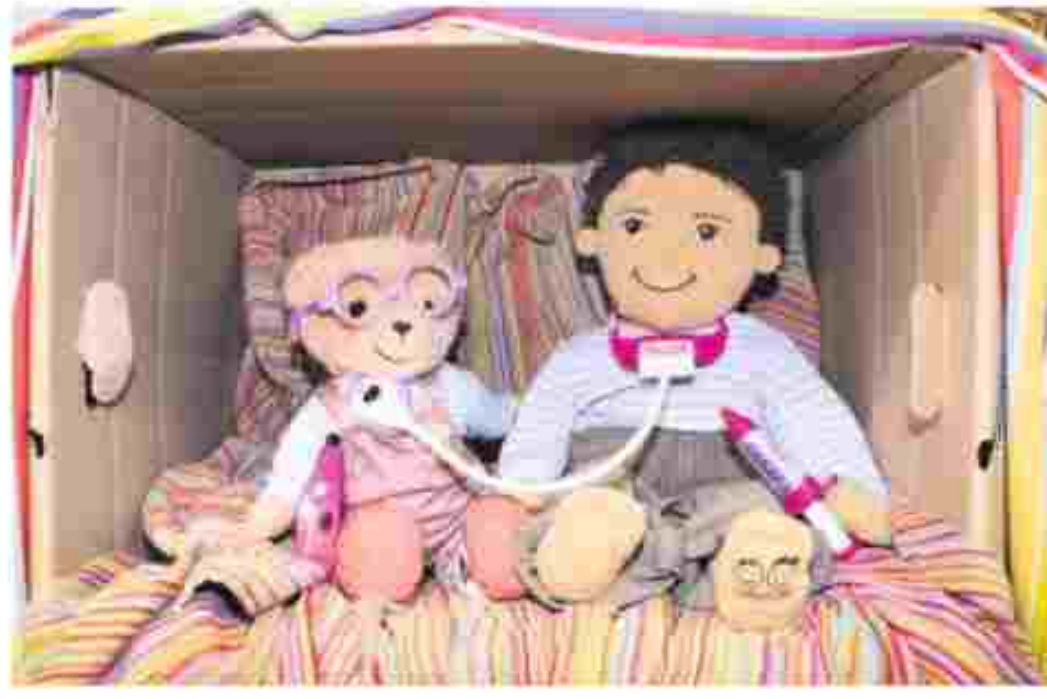
Mädchen und Jungen bauen gern Höhlen. Manche Kinder wollen darin ungestört ihre Körper erkunden. Einige Eltern befürchten Übergriffe. Pädagogen empfehlen, die Neugier der Kinder im Rahmen von Regeln zuzulassen.