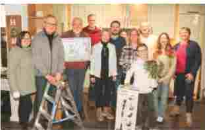
Die Gewinner der Hauptpreise zusammen mit der Firmenleitung.

Barmstedt (rs) Seit über 30 Jahren ist die Weihnachtstombola von Kuchen Johannsen fester Bestandteil der Barmstedter Adventszeit. Etwa 1750 Lose wurden diesmal verkauft. Die hochwertigen Preise der Tombola wie eine Küchenzeile, ein Staubsauger, eine Mikrowelle, eine Leiter und vieles mehr sammelt die Familie Johannsen jedesmal bei Partnern der