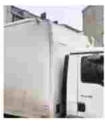
Der Transporter wurde am Dach beschädigt. Stunde gesperrt. Viele Züge fielen aus. Im September blieb ein Elektrobus in dem Tunnel stecken und fing an zu brennen.

Elmshorn (JH) Schon wieder hat es im Geschwister-Scholl-Tunnel gekracht. Ein Transporter prallte am Montag gegen 8.50 Uhr gegen das Bauwerk, teilte Hanspeter Schwartz, Sprecher der Bundespolizei, mit. Das Fahrzeug war für die Bahnunterführung zu hoch. Ein abgehangenes Brett soll zwar als Höhenwarnsystem dienen. Doch es hielt den 26-jährigen Fahrer nicht auf, den zu hohen Transporter in die Unterführung zu steuern. Der Wagen wurde stark beschädigt. Der Fahrer konnte ihn aber zurücksetzen. Die drei Gleise über dem Tunnel wurden für etwa eine