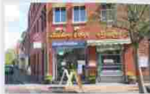
Die Elmshorner Stadtbäckerei Sedemund eröffnet am 1. Februar ihre neue Filiale im ehemaligen Café Klingbeil.

Glückstadt/Elmshorn (rs) Das ist eine richtig gute Nachricht für Glückstadt. Noch längerem Leerstand übernimmt das Elmshorner Traditionsunternehmen Sedemund das ehemalige Café Klingbeil am Markt 7.